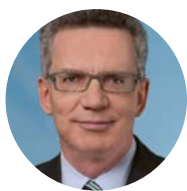
Dr. Thomas de Maizière Bundesminister des Innern

„Integration stellt eine der großen gesellschaftlichen Herausforderungen dar. Dass ein so bedeutendes Thema auch Spiel, Spaß und Erlebnis bedeuten kann, wird durch Sport erlebbar. Wir haben die Integrationspotenziale des Sports bislang außerordentlich erfolgreich genutzt, aber noch nicht ausgeschöpft. Daher wollen wir mit diesem Handlungsleitfaden zeigen, wie Vereine und Verbände dazu beitragen können, Rahmenbedingungen weiter zu verbessern, Teilnahmebarrieren abzubauen und so genannteherkunftsspezifische Sportarten auszuweiten. Auf diese Weise sollen die in den Vereinen unterrepräsentierten Gruppen, wie Frauen und Mädchen mit Migrationshintergrund sowie ältere Menschen noch besser angesprochen und einbezogen werden. In dem Handlungsleitfaden finden Sie wertvolle und hilfreiche Informationen, Anregungen, Tipps und Praxisbeispiele rund um das Thema Sport und Integration.“